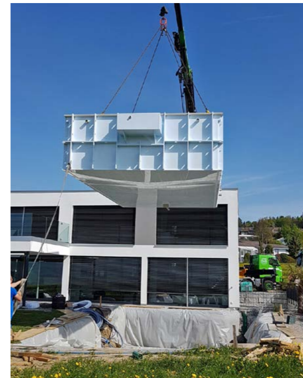
Bis der Pool geliefert werden kann, braucht es einiges an Vorarbeiten.

Natürlich. Jedoch ist für eine Beratung mit oder ohne einem Probad eine telefonische Voranmeldung notwendig.